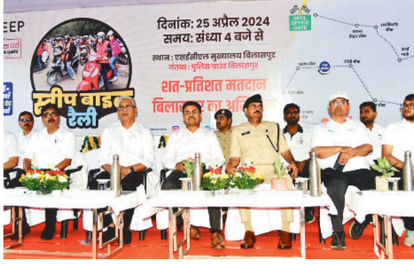
एसईसीएल के कार्यक्रम में उपस्थित सीएमडी व अन्य अतिथि।

रैली में महिलाओं ने भी उत्साह के साथ भाग लिया। एसईसीएल कार्यालय से रैली शुरू होकर शहर के प्रमुख मार्गों से होते हुए पुलिस परेड ग्राउंड में समाप्त हुई। रैली के दौरान बाइकर्स का जोश और उत्साह देखते बन रहा था। शत-प्रतिशत