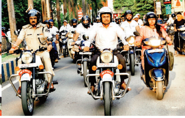
मतदाता जागरूकता बाइक रैली का नेतृत्व करते कलेक्टर व एसपी।