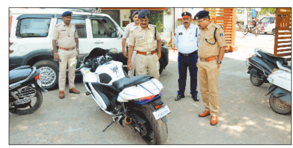
तेज रफ्तार में बाइक चलाना बना फैशन

की रात सत्यम चौक पर मॉडिफाइड साइलेंसर लगाकर सुजुकी हायबुजा में एक युवक निकल रहा था। ट्रैफिक के अधिकारी व जवानों ने बाइक सवार को रोककर जांच की तो उसमें मॉडिफाइड साइलेंसर लगा होना पाया गया। पुलिस ने साइलेंसर निकालकर बाइक को जब्त कर लिया है। जब्त बाइक की कीमत 21 लाख रुपए बताई जा रही है। पुलिस बाइक संचालक के खिलाफ मोटर व्हीकल एक्ट के तहत प्रकरण बनाकर कोर्ट में पेश करेगी। अब संचालक को कोर्ट से बाइक छुड़ानी पड़ेगी। ज्ञात हि पिछले दिनों ट्रैफिक पुलिस ने मॉडिफाइड साइलेंसर लगाकर फरटि मारते 13 लाख की बाइक जब्त की थी।