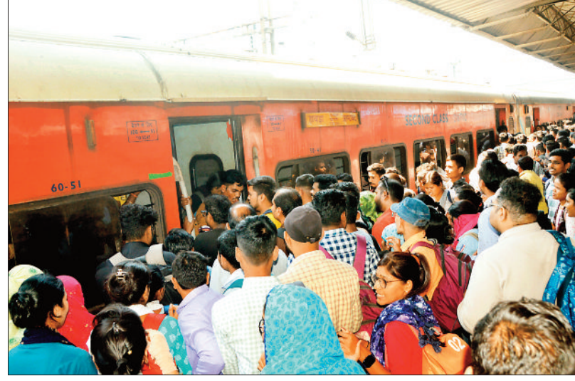
ट्रेन में सफर के लिए यात्रियों की स्टेशनल में लगी भीड़। सीट के लिए ट्रेन में जददो जहद करते रेल यात्री।

एक ओर देश के 508 रेलवे स्टेशनों की तस्वीर बदलने वाली है, जिनमें छत्तीसगढ़ के बिलासपुर सहित 7 स्टेशन शामिल हैं, लेकिन दूसरी ओर कई ट्रेनें 9-21 घंटे देर, आठ दिन और अधिक देर से चल रही हैं। ट्रेनों की लेटलतीफी और देर होने से यात्री परेशान हैं।