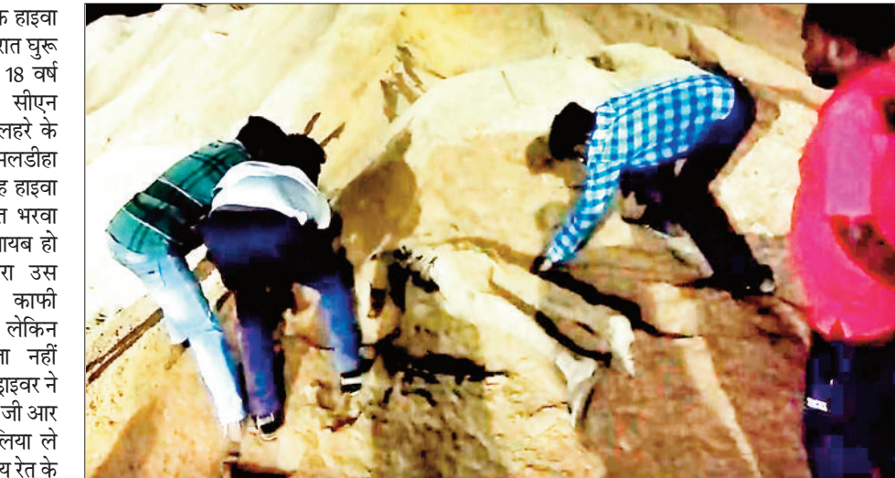
हाइवा से खाली की गई रेत से हेलपर की लाश निकालते लोग।