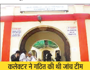
कलेक्टर ने गठित की थी जांच टीम

बिलासपुर जिले में राजस्व मामलों की पेंडेंसी साढ़े नौ हजार के पार पहुंच गई है। कलेक्टर से लेकर पटवारी, बाबू तक प्रशासन का सारा तंत्र पिछले दो माह से लोकसभा निर्वाचन कार्य में व्यस्त है, जिसके चलते फिलहाल पेंडेंसी कम होने की कोई संभावना नहीं है। दूसरी तरफ कलेक्टर द्वारा एसडीएम व तहसील न्यायालयों में पेंडेंसी की जांच के लिए टीम बनाई गई थी, किन्तु बि ला स पुर तहसील के आगे बाकी रिपोर्टों तक जांच नहीं बढ़ पाई।